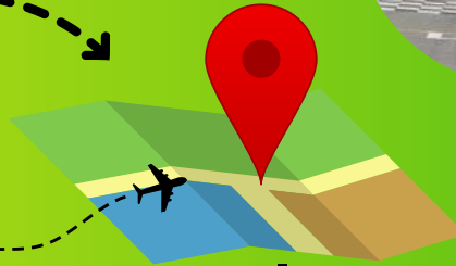
Aeroporto internacional de Carrasco